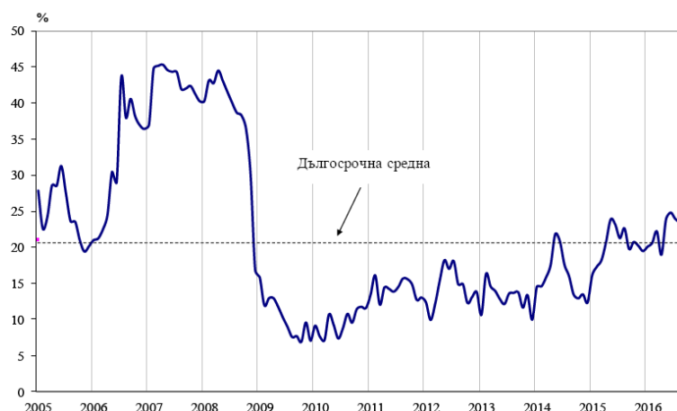
Фиг. 1. Бизнес климат - общо

По данни на НСИ през септември 2016 г. общият показател на бизнес климата запазва нивото си от предходния месец.